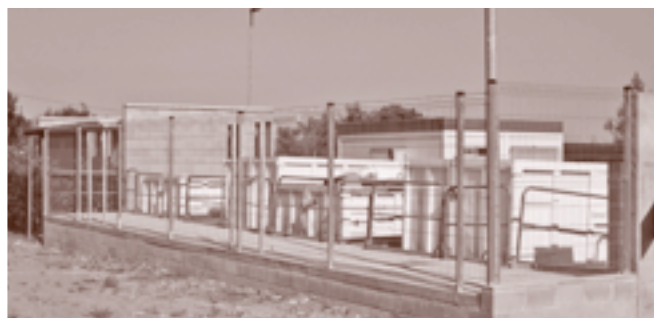
Properament s'ampliaran les instal·lacions de la deixalleria