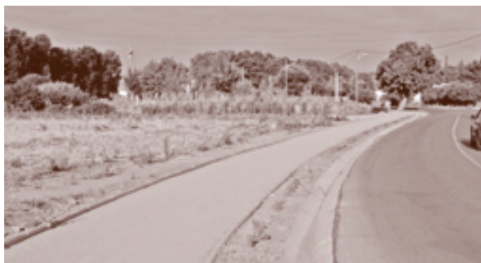
Pas de vianants del camí del Gual