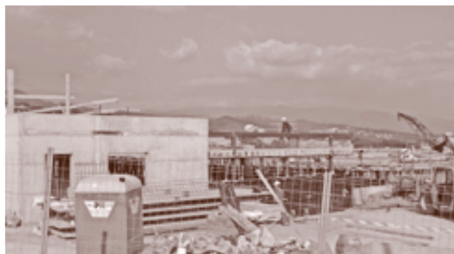
Estat actual de les obres del segon CEIP.