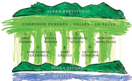
SISTEMES NATURALS I VIES VERDES DEL VALLÈS